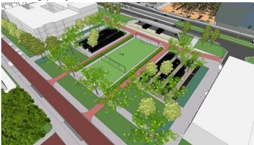
Ontwerp tijdelijke bovengrondse fietsenstallingsplaatsen

De projectorganisatie Zuidasdok en de gemeente Amsterdam zijn met de omgeving in gesprek gegaan over een tijdelijke fietsenstalling op de Vijfhoek, het parkje op de kop van de Minervalaan. Er zijn meerdere locaties aangedragen en onderzocht, maar niet geschikt bevonden. In een vijftal ontwerpessies is er samen een mooi ontwerp gemaakt voor een tijdelijke bovengrondse fietsenstalling op de Vijfhoek.